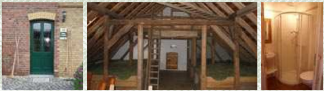
von Mai bis Oktober, im eigenen Schlafsack