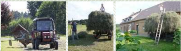
Ein bleibendes Erlebnis – Übernachten im Heu